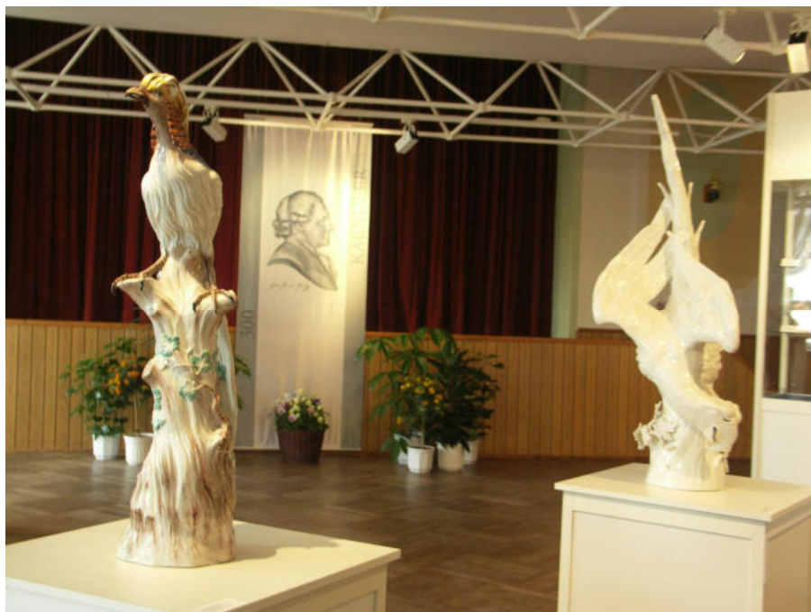
Der Saal des Erbgerichts zur Kändlerausstellung 2006