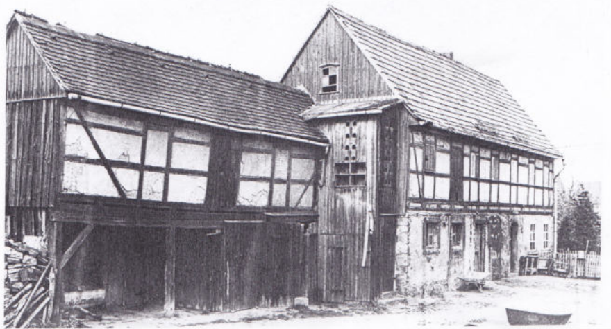
Das Ausgedingehaus mit Anbau

Vater Wünsche ist es zu verdanken, daß der Eingang des Hofes von 2 Kastanienbäumen beschattet wird. Hinter der Scheune stehen uralte Linden, die aus manchem Jahrhundert erzählen könnten. Der außergewöhnliche hohe und starke Birnbaum wird schon 1664 als im Himbeergärtchen stehend, bei der Gutsübergabe erwähnt. Die Kaufprotokolle der Gerichtsbücher erzählen auch sonst mancherlei Interessantes. Hans Rüdiger mußte 1705 versprechen für seine Stiefkinder wie ein leiblicher Vater zu sorgen und „sie bis ins 12 Jahr, Sommer und Winter fleißig zur Schule zu halten.“ Zur Bewirtschaftung des Gutes wurden ihm belassen; 4 Kühe, 4 Kalben, 2 Ochsen, 2 Gesindbetten, ferner „beym Guthe eine gute Biebel“ usw. 1690 ist zu lesen; „So auch etwa ein Geschwister krank werden möge, soll der Käufer daselbst zu sich nehmen, Hauß und Stube vergönnen und einräumen, bis es demselben zur Besserung oder zum Tode ausschlagen möge.“ Oft wird auch die Kammer bei der Feuermauer genannt, die den unverheirateten Geschwister des Besitzers zum aufbewahren Ihrer Sachen dienen soll. Ferner sichern sich die Altbesitzer nicht allein das Ausgedingehäuschen, sondern auch einen einen bequemen Platz in der großen Stube.