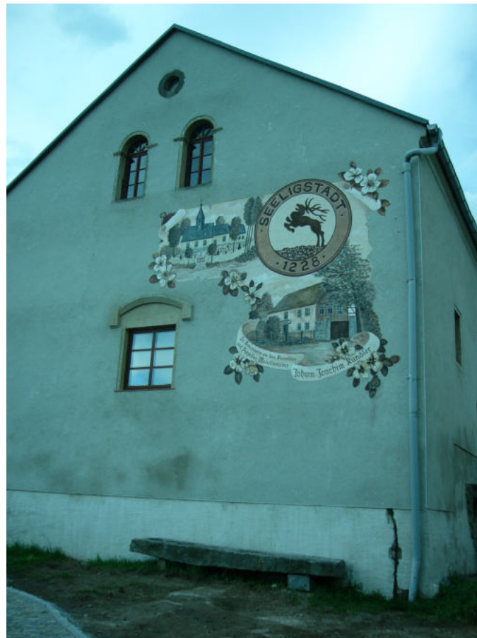
Kändlergöbel (2009) am Nebengebäude des Erbgerichts (Kändler war ein Zeitgenosse Pöppelmanns )