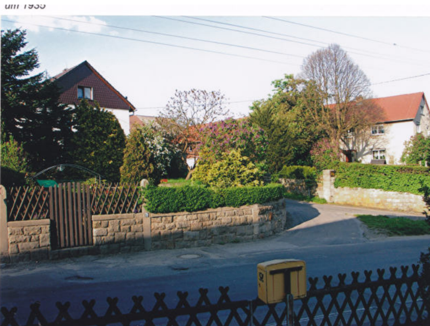
Das Bauerngut Rüdiger um 1960 und heute